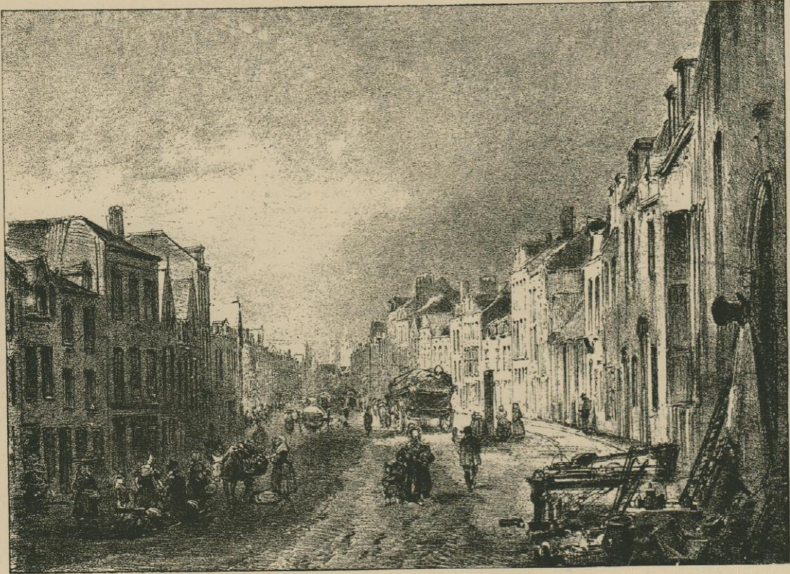
LA RUE HAUTE. Lithographie de Fourmois.

Voici plus loin le vieux Palais de Justice, qui s'effrite et se fendille aujourd'hui de toutes parts, comme une coque de navire vermoulue et faisant eau. Vers 1840, on